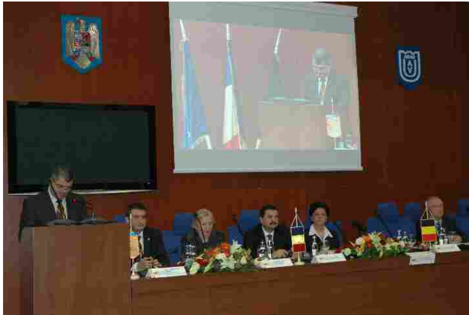
Forumul cooperării descentralizate Româno-Belgian „De la solidaritate la parteneriatul European,, în luna noiembrie 2010