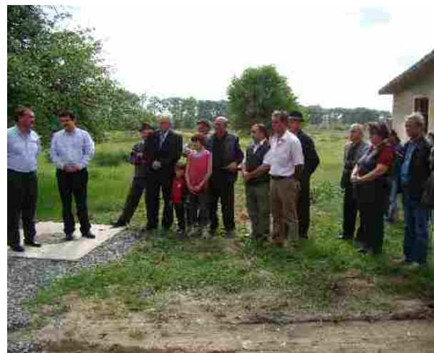
Vizita comuna Beliu luna mai 2010: inaugurarea rețea de alimentare cu apă și teren de fotbal în localitate;