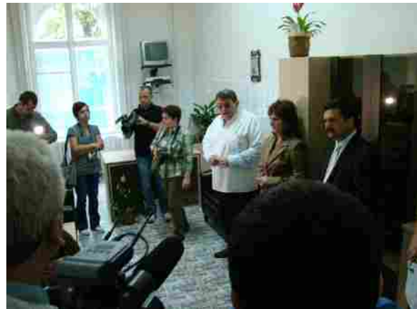
Vizită și inaugurare rezerve Spitalul Matern- luna mai 2010