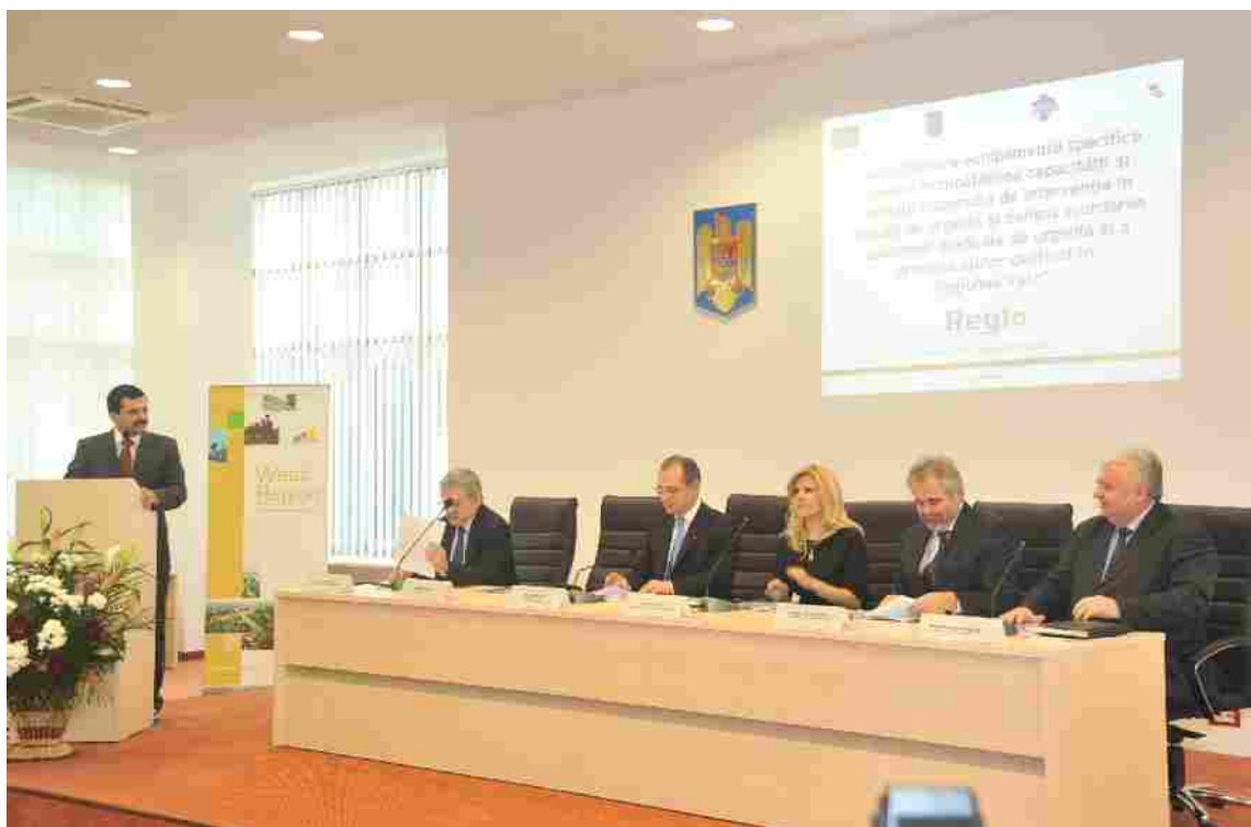
Ședința ADR Vest prezidată de prim ministrul al României dl. EMIL Boc, cu participarea dnei ministru Elena UDREA luna martie 2010