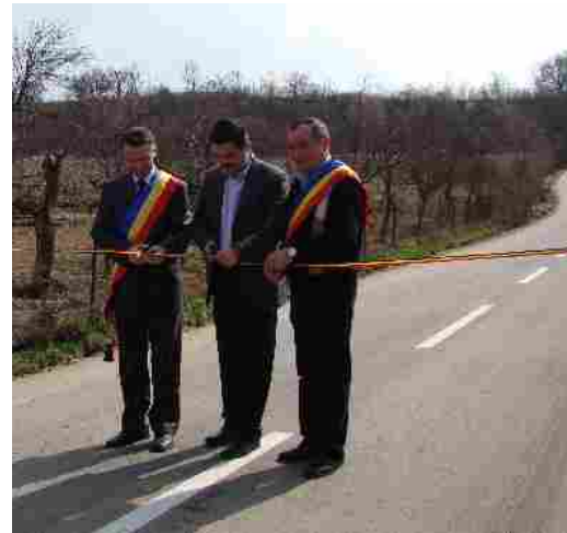
Inaugurare DJ 793 Hasmas-Archis luna martie 2010