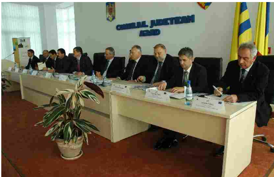
Ședința REGIO – noiembrie 2010