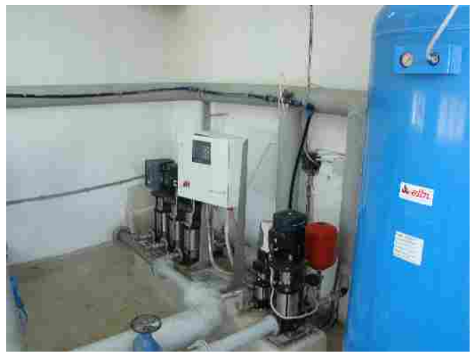
Inaugurare rețea de alimentare cu apă în satele Mailat și mănăștur, com. Vinga luna iulie 2010