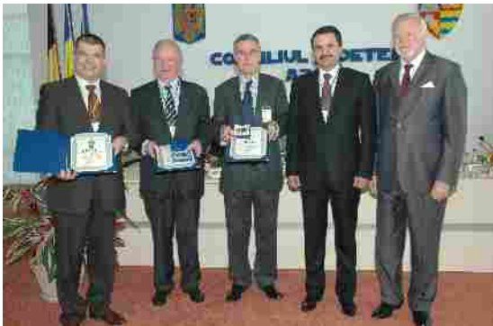
Acordarea unor distincții participanților la forumul româno-belgian