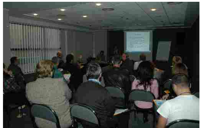
Secvență din timpul desfășurării atelierelor de lucru