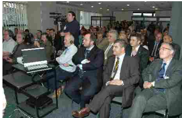
Secvență din timpul desfășurării atelierelor de lucru