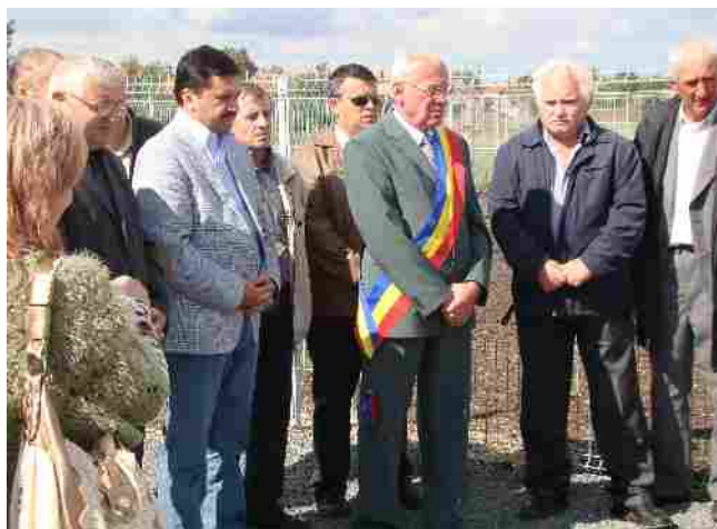
Inaugurarea rețea de alimentare cu apă în localitatea Sâmbăteni, com. Păuliș în luna august 2010