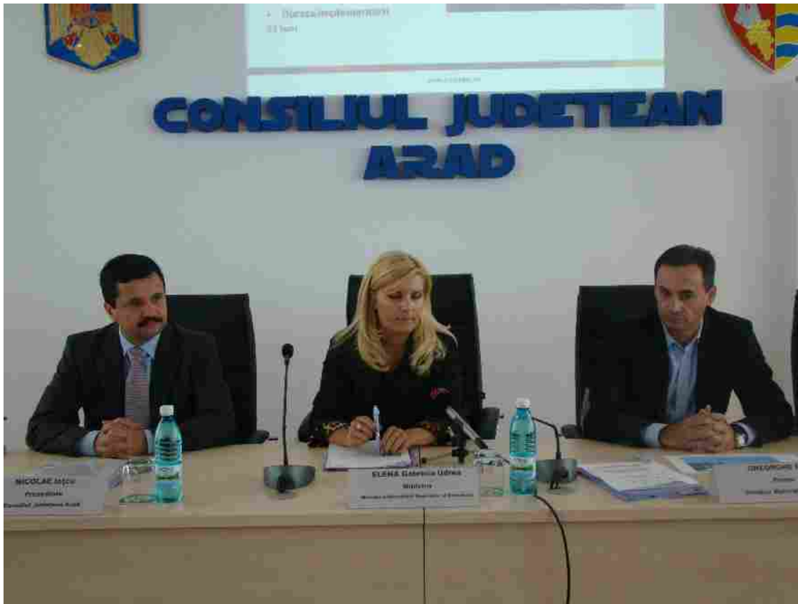
Semnarea celor cinci contracte de finanțare cu fonduri europene în prezența dnei. ministru Udrea Elena în luna septembrie 2010