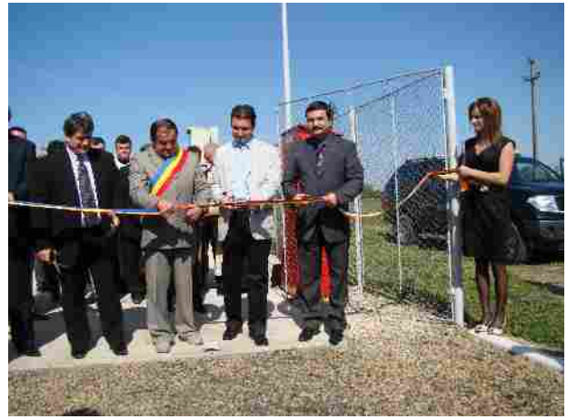
Luna aprilie 2010 vizita în orașul Pâncota – finalizare și inaugurare a 4 obiective de investiții din oraș