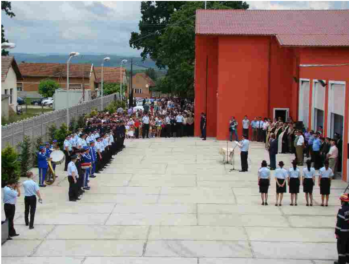
Ceremonia de sfințire și inaugurarea a sediului „Garda de Intervenție nr. 2 Birchiș,, în luna iunie 2010